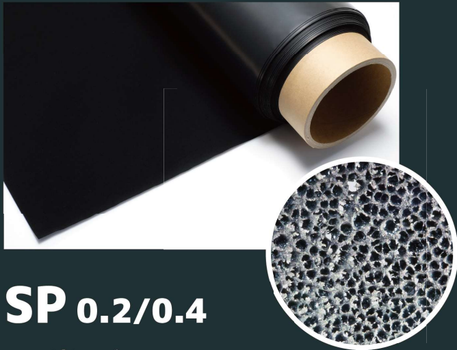
SP 0.2/0.4 通常グレード